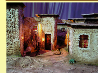
Ricerca della locanda.