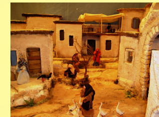
Vita nel villaggio, particolare.