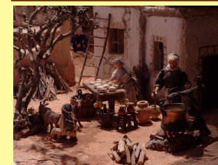
Casari, preparazione formaggio di capra.