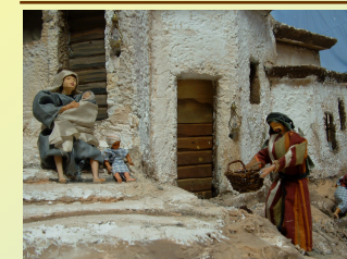
I bambini sono sempre i protagonisti.