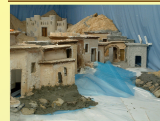
Il laghetto durante i lavori, particolare.