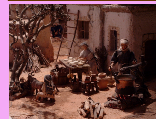
Casari, preparazione formaggio di capra.