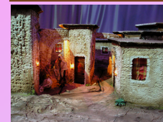
Ricerca della locanda.