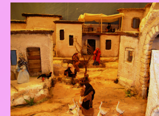
Vita nel villaggio, particolare.