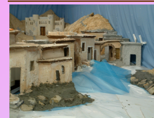
Il laghetto durante i lavori, particolare.