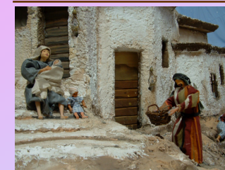
I bambini sono sempre i protagonisti.